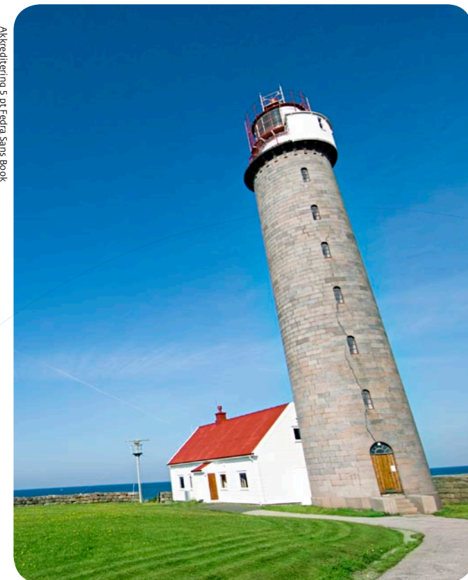
Akkreditering 5 pt Fedra Sans Book

Ingress: 9 pt/12 pt Fedra Sans Medium. Kan settes i brosjyrefargen (fargen som er tilknyttet tjenesteområdet), sort eller hvit avhengig av hva som passer best med bakgrunnen. Det skal være en blank linje på 12 pt mellom ingress og brødtekst. Ingressen kan løpe over en eller flere spalter (se side 10), men aldri over hele siden eller i den smaleste spaltebredden.